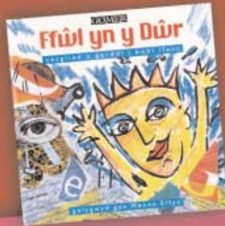
Ffwl yn y Dŵr - Casgliad o Gerddi i Bobl Ifanc (1999) Gomer £5.50 (Casgliad o gerddi amrywiol gan 11 o feirdd cyfoes a olygwyd gan Menna Elfyn)

Menna Elfyn oedd Bardd Plant Cymru 2002 - 2003