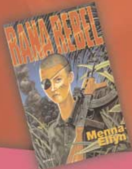
Rana Rebel (2002) Gomer £4.95 (nofel ar gyfer darllenwyr oed 12 - 16)