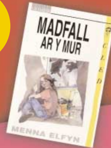
Madfall ar y Mur (1993) Gomer £3.95