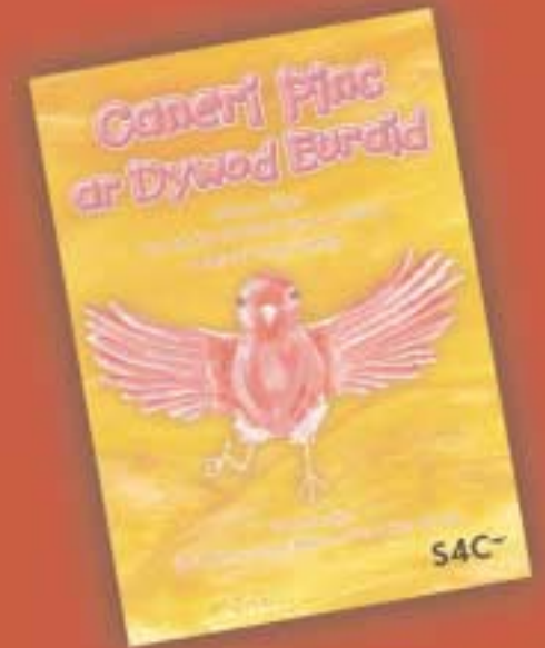
Caneri Pinc ar Dywod Euraid Cerddi Bardd Plant Cymru 2002-3 a Beirdd Ifanc Cymru (2003) Hughes £4.99

Mae'n bosib dysgu sut i sgrifennu os ydych am fod yn awdur. Mae'n fater o ddarllen digon, cadw llyfr a sgrifennu ynddo bob dydd a chasglu geiriau newydd. Ac yna, fe ddaw'r syniadau. Credwch fi. Achos dyna ddigwyddodd i mi.