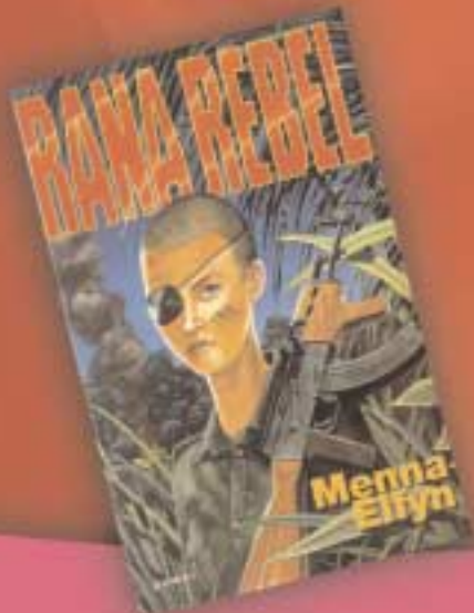
Rana Rebel (2002) Gomer £4.95 (nofel ar gyfer darllenwyr oed 12 - 16)